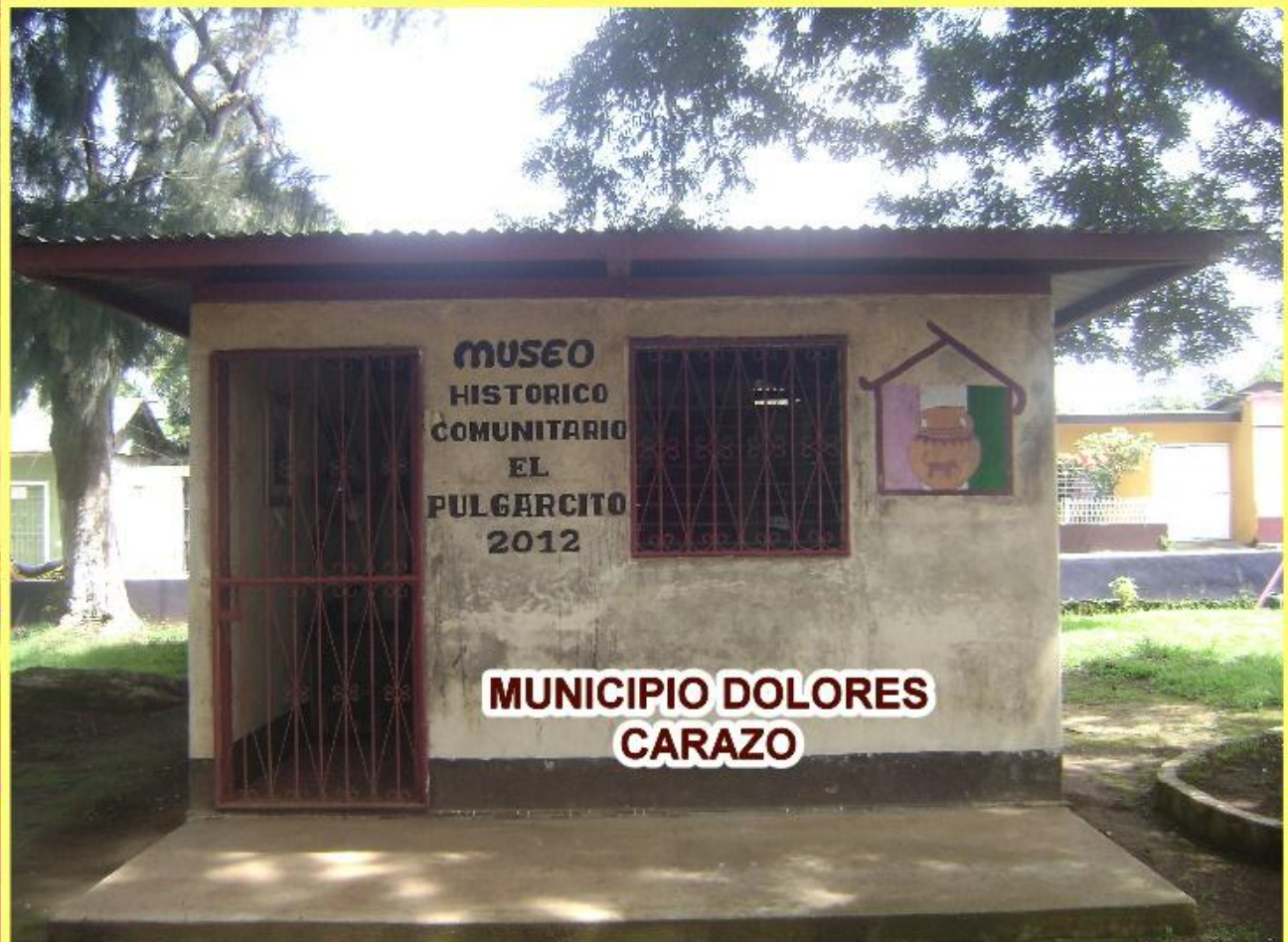
MUNICIPIO DOLORES CARAZO