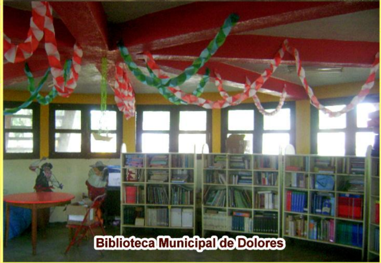
Biblioteca Municipal de Dolores